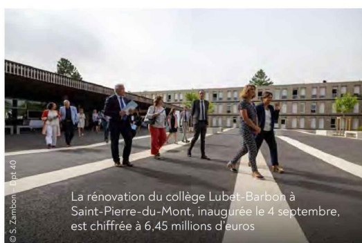
La rénovation du collège Lubet-Barbon à Saint-Pierre-du-Mont, inaugurée le 4 septembre, est chiffrée à 6,45 millions d'euros

Les adeptes des camping-cars et fourgons aménagés aiment les Landes. Le réseau Camping-car Park, comptabilise 68 190 nuitées, du 1 er juillet au 20 août, dans ses aires d'étapes et de services, soit une progression de 20 % dans le département par rapport à 2022. La région Nouvelle-Aquitaine, avec 198 000 nuitées sur la même période (23,4 % de la fréquentation nationale), se classe en tête des destinations favorites, juste devant l'Occitanie (14,5 %) et les Pays de la Loire (13,8 %).